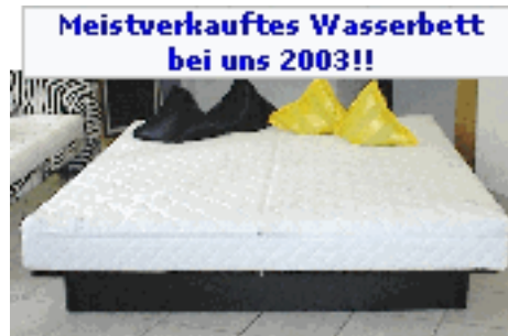
Wasserbett Aqua Nova Exclusiv

Das Aqua Nova Classic ist ein Standardmodell der Halcyon Softsider Serie. Es ist einbaufähig in alle gängigen Bettrahmen mit den entsprechenden Innenmaßen. Ebenso ist es frei aufstellbar. Das Aqua Nova Classic erhalten Sie als Uno sowie auch als Dualsystem. Das Aqua Nova Classic wird mit einer Frottee Auflage waschbar bis 60°C geliefert. Ab Bettgröße 180/ 200 ist das Oberteil der Auflage ohne Aufpreis teilbar! Der sehr stabile Schaumstoffrahmen garantiert eine lange Lebensdauer Ihres Wasserbettes! Das Magnetfeldfreie elektronische Heizsystem einstellbar von 20°C- 35°C sorgt für eine angenehme Wärme in Ihrem Wasserbett. Zum Aufbau des Aqua Nova Classic ist außer einem Wasserschlauch keinerlei Werkzeug erforderlich. Alle zum Aufbau erforderlichen Teile sind im Lieferumfang enthalten!