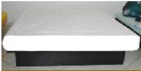
Wasserbett Aqua Nova Classic

Das Aqua Nova Classic ist ein Standardmodell der Halcyon Softsider Serie. Es ist einbaufähig in alle gängigen Bettrahmen mit den entsprechenden Innenmaßen. Ebenso ist es frei aufstellbar. Das Aqua Nova Classic erhalten Sie als Uno sowie auch als Dualsystem. Das Aqua Nova Classic wird mit einer Frottee Auflage waschbar bis 60°C geliefert. Ab Bettgröße 180/ 200 ist das Oberteil der Auflage ohne Aufpreis teilbar! Der sehr stabile Schaumstoffrahmen garantiert eine lange Lebensdauer Ihres Wasserbettes! Das Magnetfeldfreie elektronische Heizsystem einstellbar von 20°C- 35°C sorgt für eine angenehme Wärme in Ihrem Wasserbett. Zum Aufbau des Aqua Nova Classic ist außer einem Wasserschlauch keinerlei Werkzeug erforderlich. Alle zum Aufbau erforderlichen Teile sind im Lieferumfang enthalten!