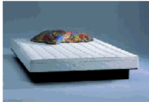
Wasserbett Luna Basic Prestige

Das Wasserbett Luna Basic Classic ist ein Exclusives Wasserbett was keine Wünsche offen lässt . Es ist einbaufähig in alle gängigen Bettrahmen mit den entsprechenden Innenmaßen. Ebenso ist es frei Aufstellbar . Das Basic Classic Wasserbett erhalten Sie als Uno sowie auch als Dualsystem. Das Luna Basic Classic wird mit einem hochwertigen Medicott ® Damast- Bezug waschbar bis 95°C geliefert. Ab der Bettgröße 160/200 ist die Auflage teilbar! Der hochwertige Schaumstoffrahmen, der auf der Bodenplatte verschraubt wird, garantiert eine hohe Lebensdauer des Luna Basic Classic. Magnetfeldfreie Digitale Heizsysteme einstellbar von 15°C- 35°C auf ein zehntel Grad genau, sorgen für eine angenehme Wärme in Ihrem Wasserbett. Der Aufbau des Luna Basic Classic ist in Verbindung mit Schraubenzieher und Wasserschlauch sehr einfach. Alle zum Aufbau erforderlichen Teile sind im Lieferumfang enthalten!