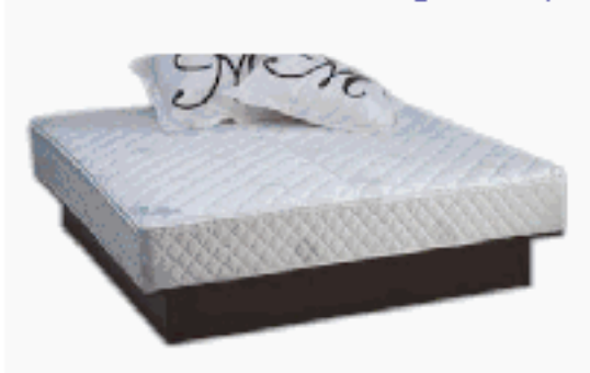
Wasserbett Luna Basic Classic

(eines der meistverkauften Wasserbetten in Europa 2003)