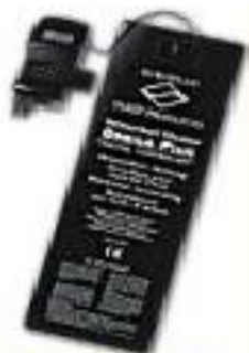
inklusive digitaler Heizungsregelung!

Ständige Kontrollen aller Rohmaterialien, der Einzelteile und der fertigen Produkte garantieren Sicherheit und Haltbarkeit.